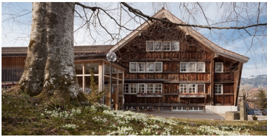
Seminar- und Ferienhotel Idyll in Gais

Erlebe an diesem Wochenende das Erwachen in dir und um dich herum mitten im idyllischen Appenzell.